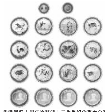
香港回归十周年徐悲鸿十二生肖纪念币大全套

欲出。这幅《十二生肖图》在“2004嘉德秋季拍卖会”上以880万元的天价拍出,刷新了此前徐先生画作拍卖的最高纪录。时间仅过了两年,价格却飞涨,据专家估算,目前此画价值已达3000万元!创下了生肖题材艺术品的拍卖纪录。有关部门经过严格筛选,才最终确定由徐悲鸿大师的孤本画作——《十二生肖图》作为首套十二生肖纪念币大全套的币图。精湛的彩银工艺将大师画作的原始风骨表现得淋漓尽致,每个生肖图案灵动动人,呼之欲出,大师夫人廖静文非常满意,认为它是展现悲鸿得意之作最佳形式。