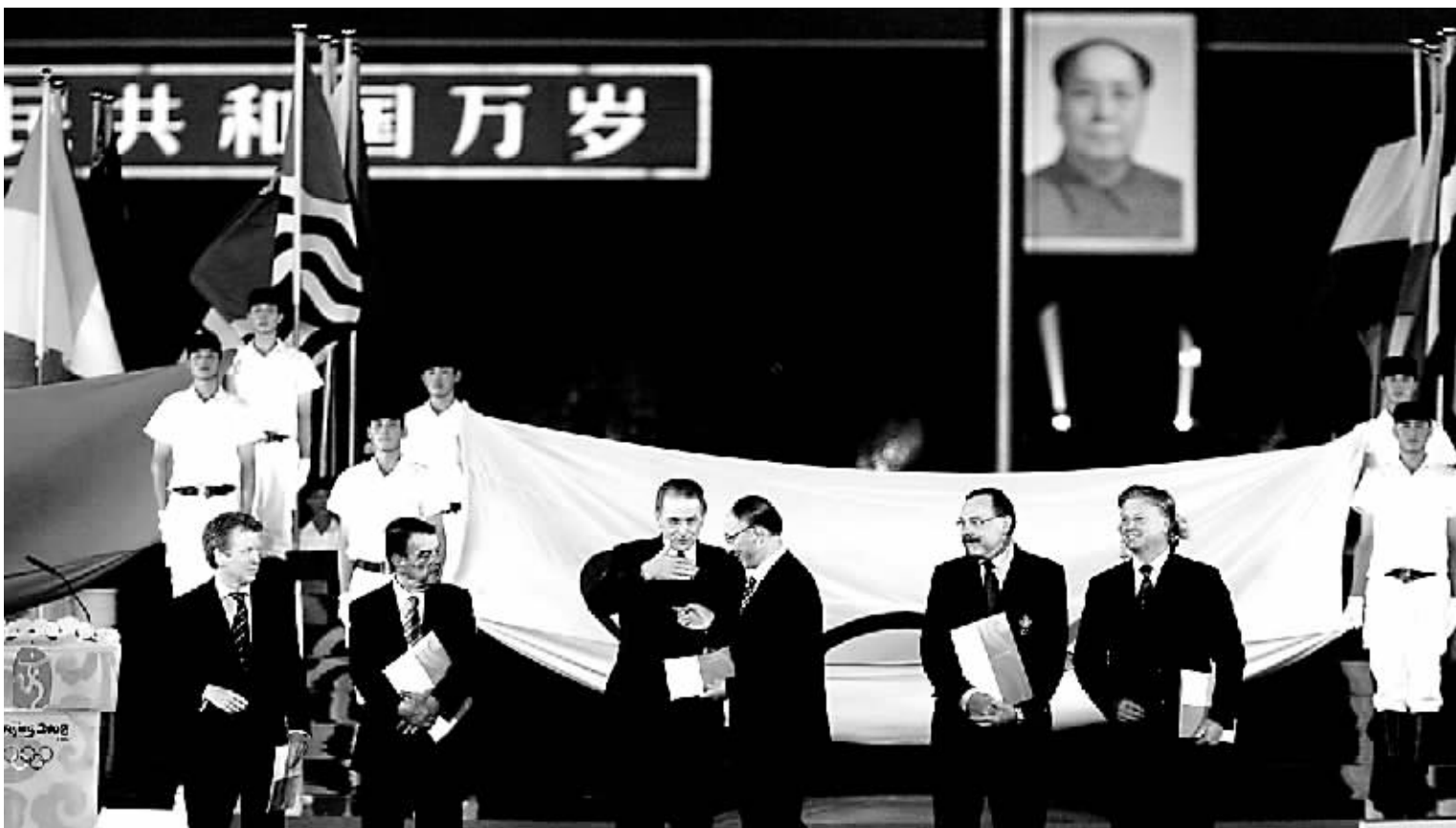
中国奥委会主席刘鹏(右三)从国际奥委会主席罗格(左三)手中接过2008年奥运会邀请函。

据了解,这也是国际奥委会首次将颁发邀请函这一重要仪式放在奥运会主办城市举行,这也充分说明了国际奥委会对中国奥运筹办工作的高度肯定。