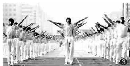
图①:人山人海,活动现场奥运气氛浓厚。 图②:灿烂微笑,功夫扇舞方阵引人注目。 图③:整齐划一,团体操队员精神抖擞。

晨报讯(记者 王娟)气定神闲的太极拳、脚步欢快灵动的秧歌操、动感十足的热舞拉拉队……昨天,“北京市迎奥运倒计时一周年全民健身优秀项目展示暨全国亿万群众迎奥运健身行活动”在中华世纪坛隆重举行。万名北京市民用最朴实的方式表达了对奥运的祝福之情。