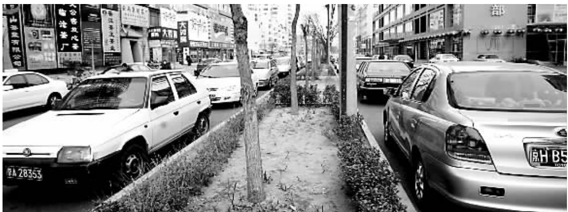
随着本市机动车数量的猛增,在部分地区出现了停车位和行人抢道的矛盾。随着《道路交通管理设施设置规范》地方标准的颁布实施,这个问题有望得到彻底解决。

人行道设停车位至少留3米宽;交通标志要让司机和行人一眼看清……记者昨天从市质监局获悉,本市首次出台的《道路交通管理设施设置规范》地方标准,在以上方面规范了交通标志、信号灯、交通标线的设置地点、形式和位置。新标准由市交管局和市质监局编写,将在今年12月1日起正式实施。