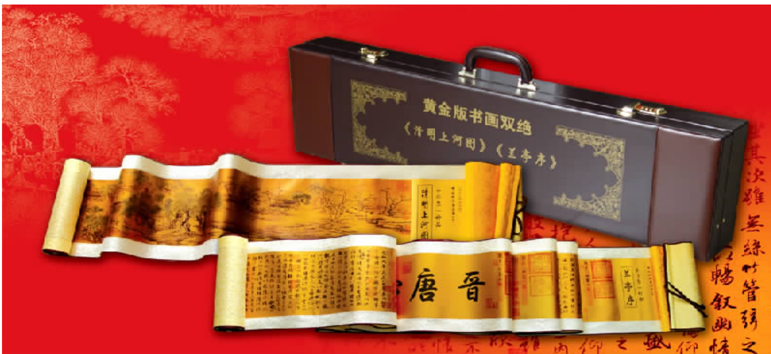
▲图为黄金版《兰亭序》、《清明上河图》实物图。

黄金“宣纸”与传统意义上的金箔有本质的不同,金箔不具备物理的强度和韧性,易破裂,不能用于机械影印,而黄金“宣纸”制作时的