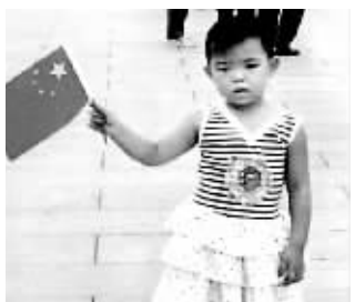
鑫瑶以前的照片。陈先生/供图