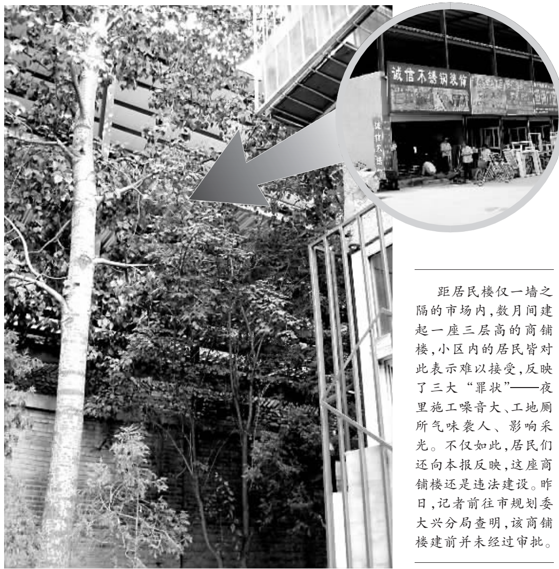
树后就是紧邻居民楼的违建。