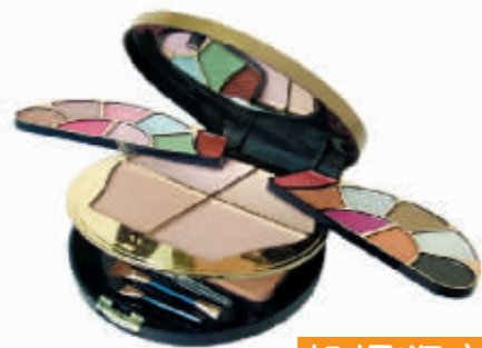
机场逛店购物秘笈

趁着长假出游本是一件让人兴奋的事情,但在机场枯燥而漫长的待机时间却往往容易让人心生烦躁。不知你有没有注意到各国机场中那些琳琅满目、比次林立的商店?其实,机场也是你不可错过的一大购物宝地,尤其是下列几大机场,赶快听听我们这些“购物达人”们是怎么说的吧。