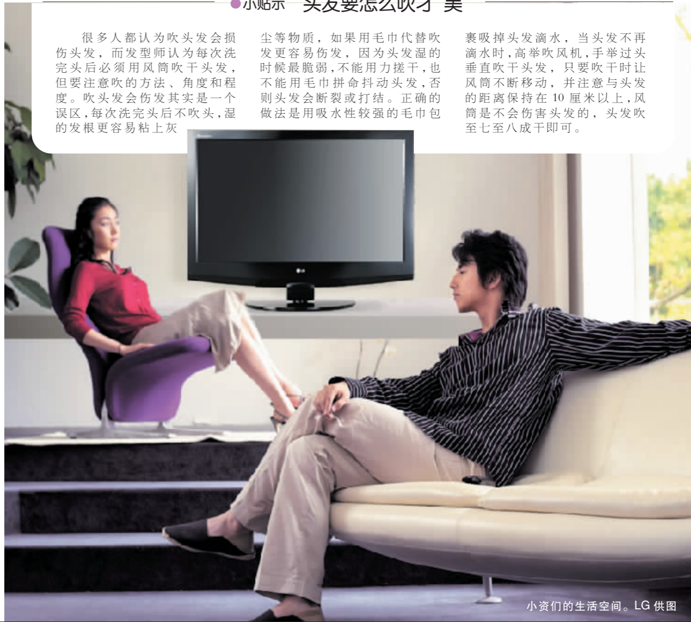
小资们的生活空间。

裹吸掉头发滴水,当头发不再滴水时,高举吹风机,手举过头垂直吹干头发,只要吹干时让风筒不断移动,并注意与头发的距离保持在 10 厘米以上,风筒是不会伤害头发的,头发吹至七八成干即可。