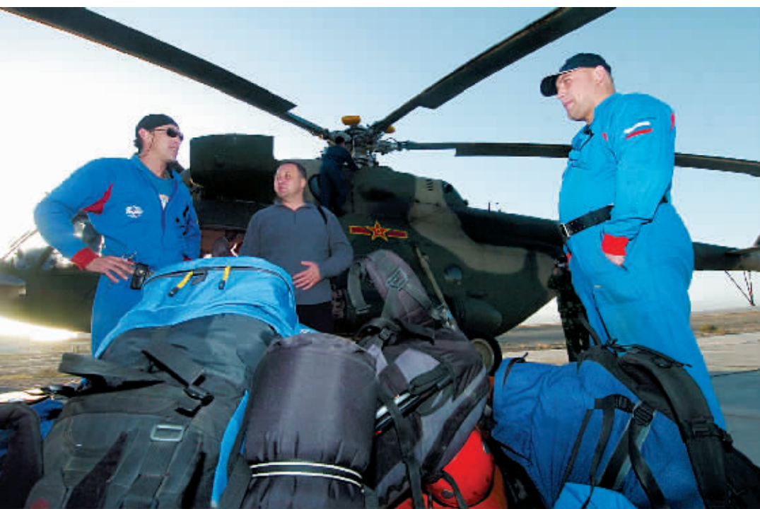
搭载8名中俄联合搜救队人员的中方直升机准备从新疆和田机场起飞。

俄罗斯救援小组负责人列文申说，这是中俄两国历史上首次进行联合大搜救，中方为搜救失踪的俄罗斯人员付出了艰苦的努力。这次参加地面搜救的5名俄罗斯人员，都是经验丰富的漂流和登山专家，其中一位还可负责医学救护。