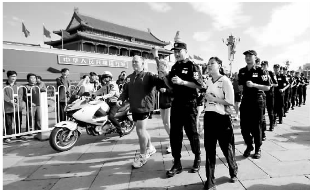
昨天,特奥会执法人员、特奥运动员代表等一起跑过天安门。

10月1日起,本市城镇无医疗保障老年人大病医保办法开始实施。据介绍,截至目前,劳动保障部门已将20余万在街道社保所办理参保的“一老”医保手册全部发放到各社保所。蒋继元提醒:“即日起参保老人可到社保所领取自己的医保手册,如果老人生病住院时还没领到参保手册,但在出院之前领到,也可按大病医保规定直接拿参保手册与医院结算医疗费用。”