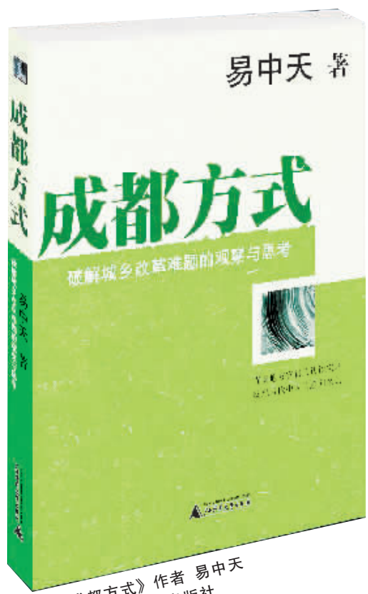
《成都方式》作者 易中天 广西师范大学出版社