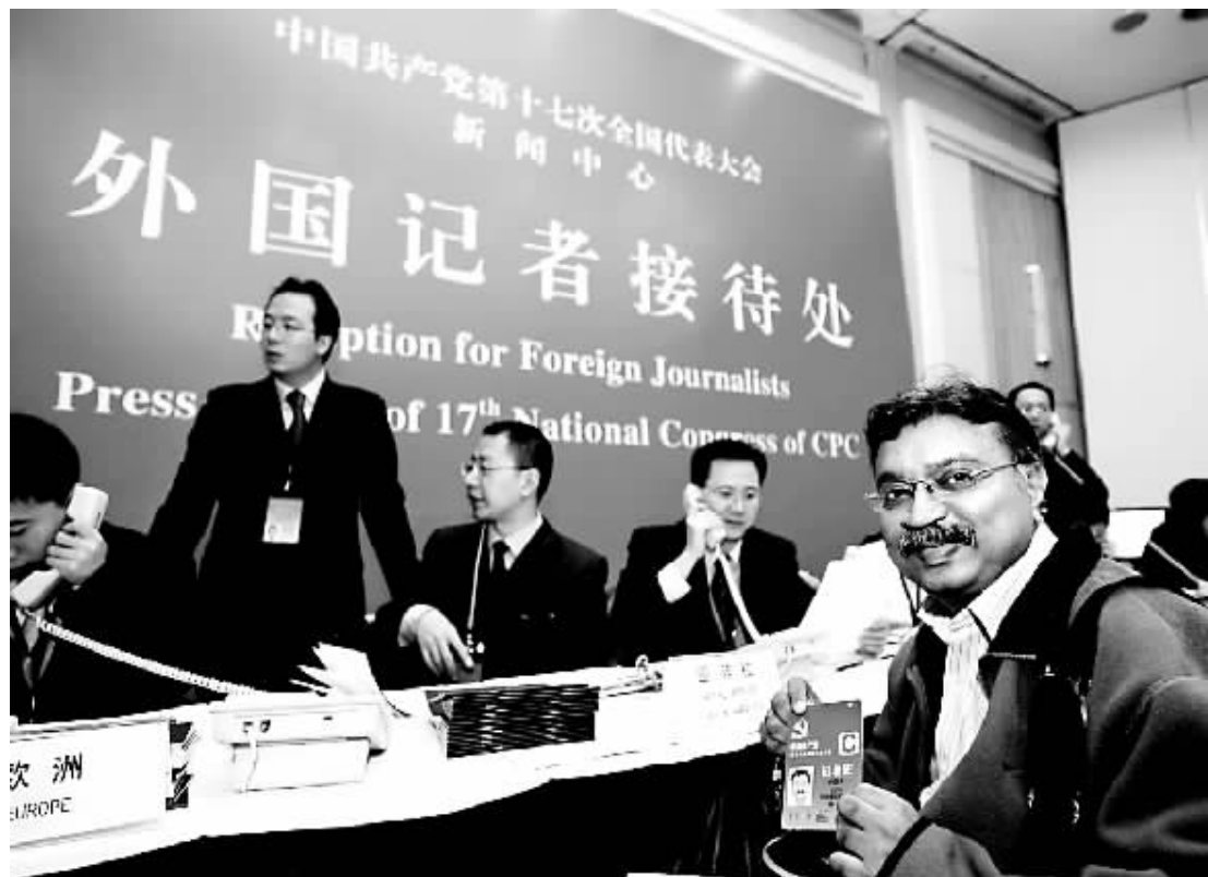
印度报业托拉斯记者约瑟夫昨天在新闻中心展示刚刚领到的记者证。

截至2007年6月,全国党员中,女党员1461.7万名,占19.9%;少数民族党员472.1万名,占6.4%;具有大专以上学历的党员2279.7万名,占31.1%。与2002年相比,女党员增加269.9万名,增长22.6%;少数民族党员增加49万名,增长11.6%;具有大专以上学历的党员增加660.6万名,增长40.8%。