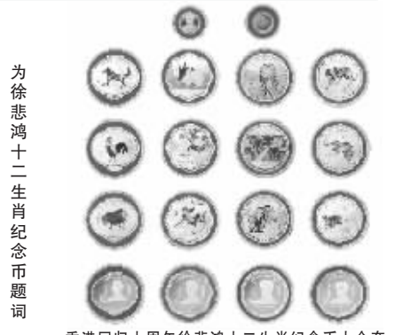
香港回归十周年徐悲鸿十二生肖纪念币大全套