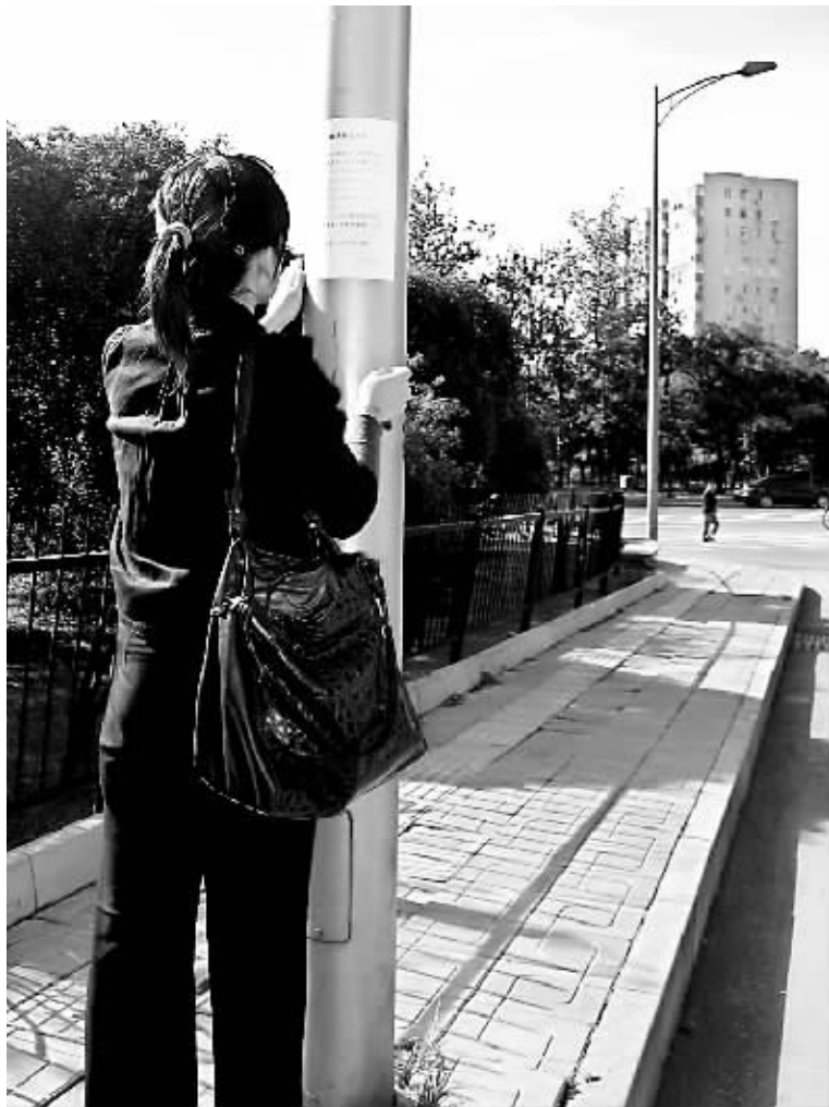
为了找到目击其父出事过程的证人,赵小姐张贴了很多寻人启事。

赶到医院时,赵小姐看到父亲已没有了意识。“我看到他的头部左上方缝了针,胸部、四肢多处都有明显的挫伤,我喊他,他却再也没有睁开过眼。”讲到这里,赵小姐难掩悲痛流下泪来。经过数小时抢救,27日凌晨3时许,医院下达病危通知,27日晚7时45分,赵小姐的父亲被宣告死亡。医生最终诊断为“脑出血引发脑疝”。但究竟是何原因导致脑出血,目前仍无法做出判断。