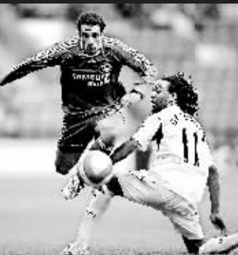
切尔西的贝莱蒂(左)带球过人。