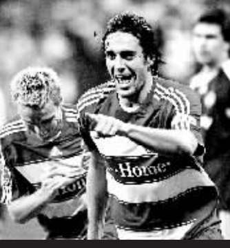
拜仁前锋托尼梅开二度。