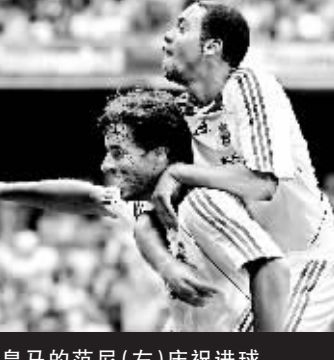
皇马的范尼(左)庆祝进球。