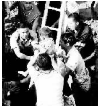
百人奋战13小时孩子顺利得救。