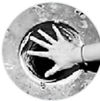
孩子掉进的桩管直径约20厘米。