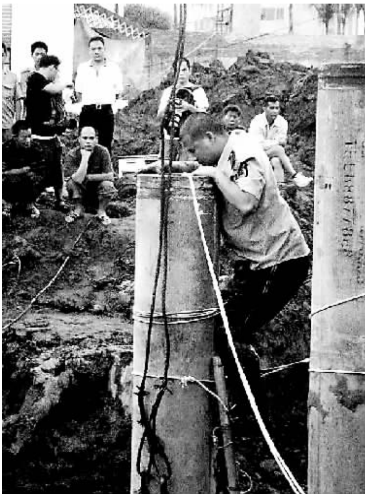
救援现场,一名消防队员往管里查看。