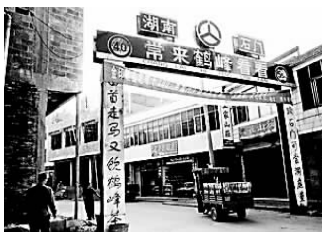
两地间群众的友谊,在门楼的对联上尽情彰显。