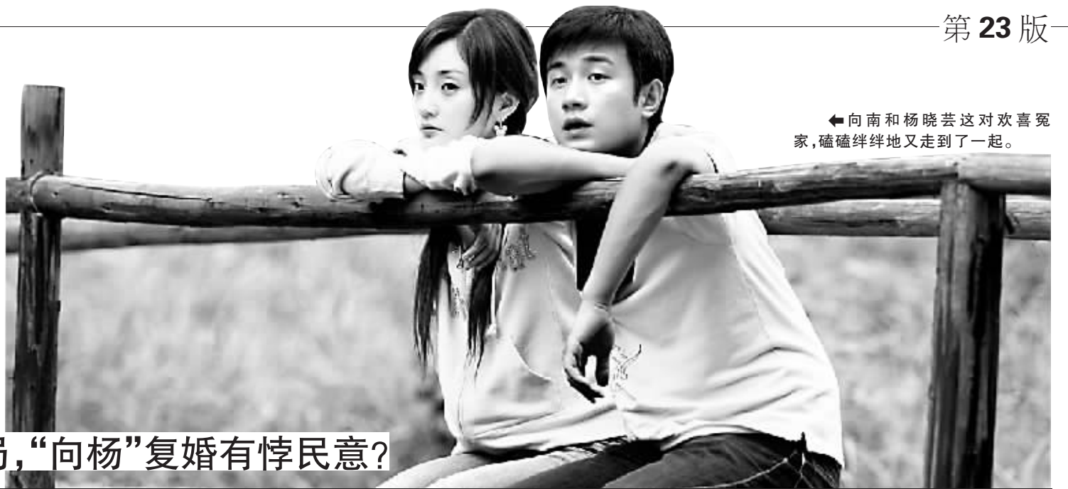
◀向南和杨晓芸这对欢喜冤家，磕磕绊绊地又走到了一起。

▶▶▶青春偶像剧《奋斗》今晚将上演大结局，该剧在“十一”黄金周竟然创下6.3%的平均收视，这让此前心里没底儿的导演赵宝刚“基本满意”。《奋斗》借着长假着实吸引了平日很少看电视的年轻人，但该剧在积累了高人气的同时也引发了不少非议，“主角太故作、配角更真实；所谓奋斗是只有爱情而无事业的奋斗；结局是个败笔”等成为观众争议的焦点。编剧石康昨天对此一一回应。