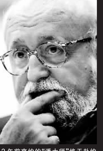
2年前爽约的“潘大师”终于赴约