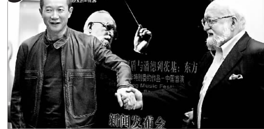
谭盾与潘德列斯基:东方特别委约作品—中国首演