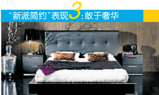
“新派简约”表现3:敢于奢华

平衡、和谐、温暖、融洽也是“新派简约”风格传达给人的主要感受,有些“新派简约”风格产品以橄榄绿、翡翠绿、淡黄绿、海藻绿等与绿色有关的色彩将自然主义渗透到居室的各个角落;纺织物、毛毡、陶制品、编制品等手工制品,让人从简单的自然取物中感受到生活的清新脱俗;可延展的胡桃木餐桌、刚柔并济的橡木床、褐色皮质的扶手椅、绒布面料的宽大沙发以及简单到只有一块玻璃构成的茶几装扮出的餐厅、书房、客厅。