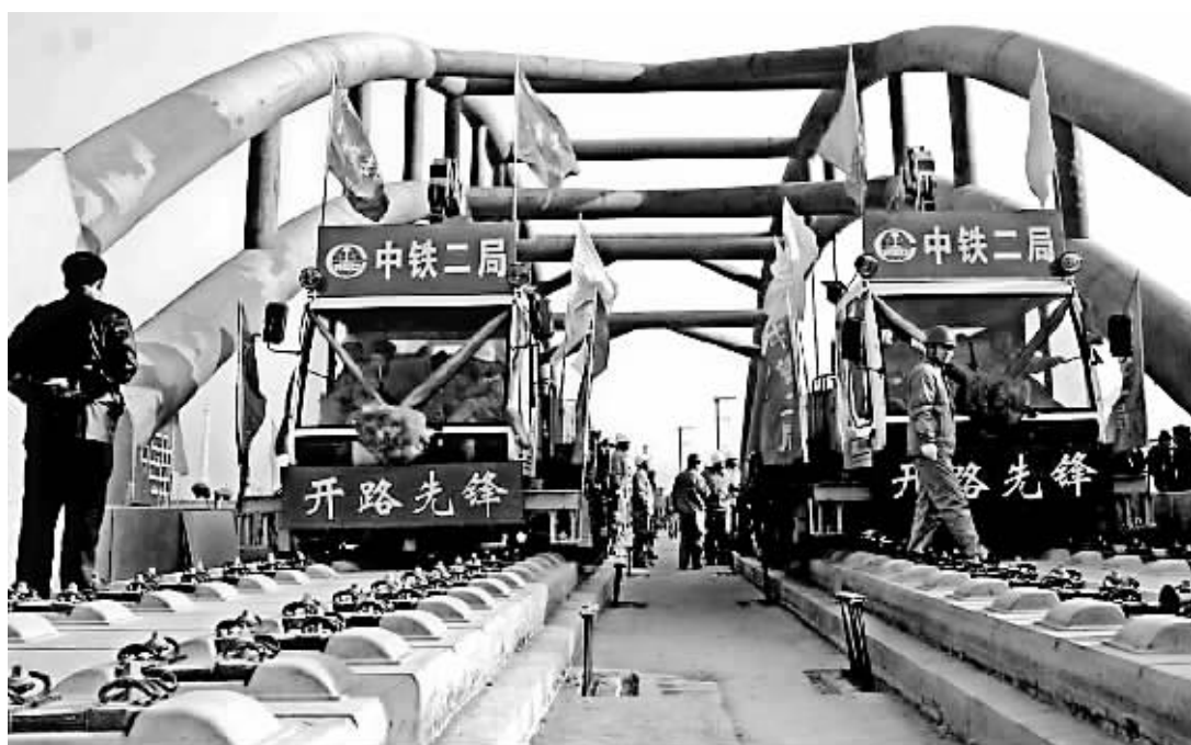
路基不用小石块,铁轨、枕木直接铺在混凝土路面上,列车行驶速度更快,更稳,噪音更低。京津城际铁路技术含量之高在我国铁路建设史上前所未有。

为起始点。据了解,除了京津城际铁路外,京沪高速铁路等“快线”以后都将从北京南站始发,而规划中,地铁4号线将以南北走向穿过北京南站,地铁14号线以东走向穿过