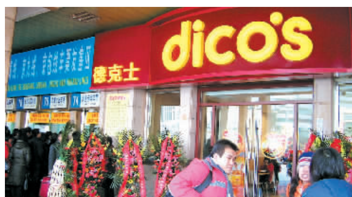
北京站餐馆盈利状况(以康师傅私房牛肉面为例) 田滢/制图

午间时分,记者在德克士和康师傅私房牛肉面馆看到,其上座率都不到一半。由于原来的寄存处暂时转移到面馆二层角落,还吸引了不少拎着大包小包的旅客踏进了面馆的大门。人气最旺的还是肯德基,基本每个收银台前都5个人以上在排队。晨报记者 杜娟 文并摄