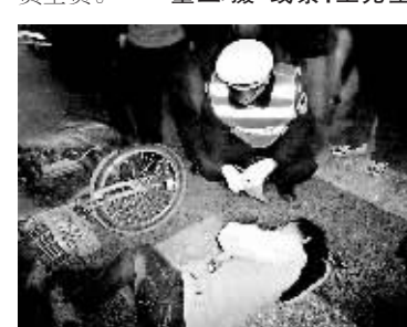
董正/摄 线索:王先生

晨报讯(记者 董正)昨晚6点半时,东中街东环广场B座南门外地下车库入口发生一起交通事故。一辆切诺基由南向北行至此处欲左转弯时,与一名骑电动自行车由北往南直行的20多岁的小伙子相撞,致使这名小伙子当场翻倒在地,腿部受伤(见图),随后被120送往积水潭医院救治。肇事切诺基停在路中,占据了半条车道,由于此处为双向车道,事故路段出现短时间交通拥堵。交警对事故进行了处理,认定切诺基负全责。 董正/摄 线索:王先生