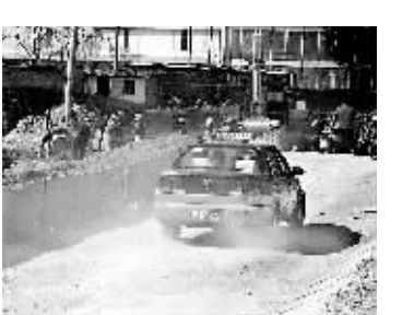
此走过,有的居民则干脆戴上围巾、帽子和口罩。

昨天,记者来到位于朝阳区双井桥东北角的时代国际和天之骄子小区,发现通往两小区的这条小路上沙尘密度果然非同一般,离小区大门还有数百米远,记者已经置