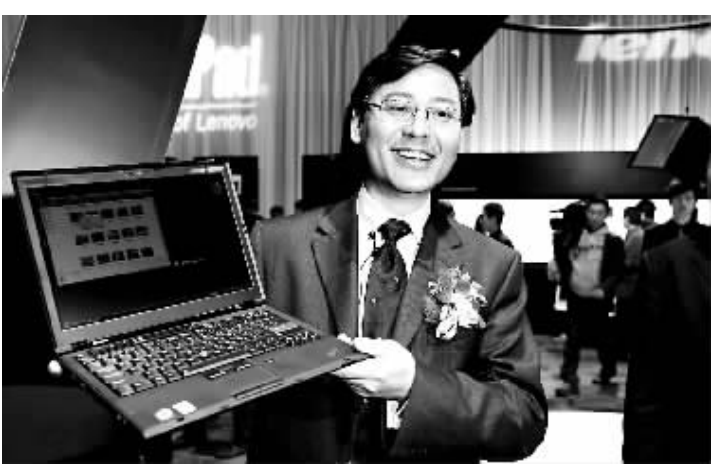
杨元庆罕见地现身联想新品发布现场。

更表示,自己曾将这款产品带上今年的“两会”,产品引起政协委员们的极大兴趣。 从重量上看,ThinkpadX300掂量起来仅相当于一份报纸,而它的厚度也只等于一毛钱硬币的直径,据了解,这款产品已经研发了近两年,研发代号为“小太刀”,取其轻薄的特点。昨日,联想高层也在发布会上点评了苹果等其他公司的轻薄笔记本产品,联想集团副总裁倪晓辉表态说,“我们知道前期有一款‘超薄超轻的笔记本’,也是全球很热门的机器,可是它不支持有线上网,也没有光驱,给用户增加了麻烦。”