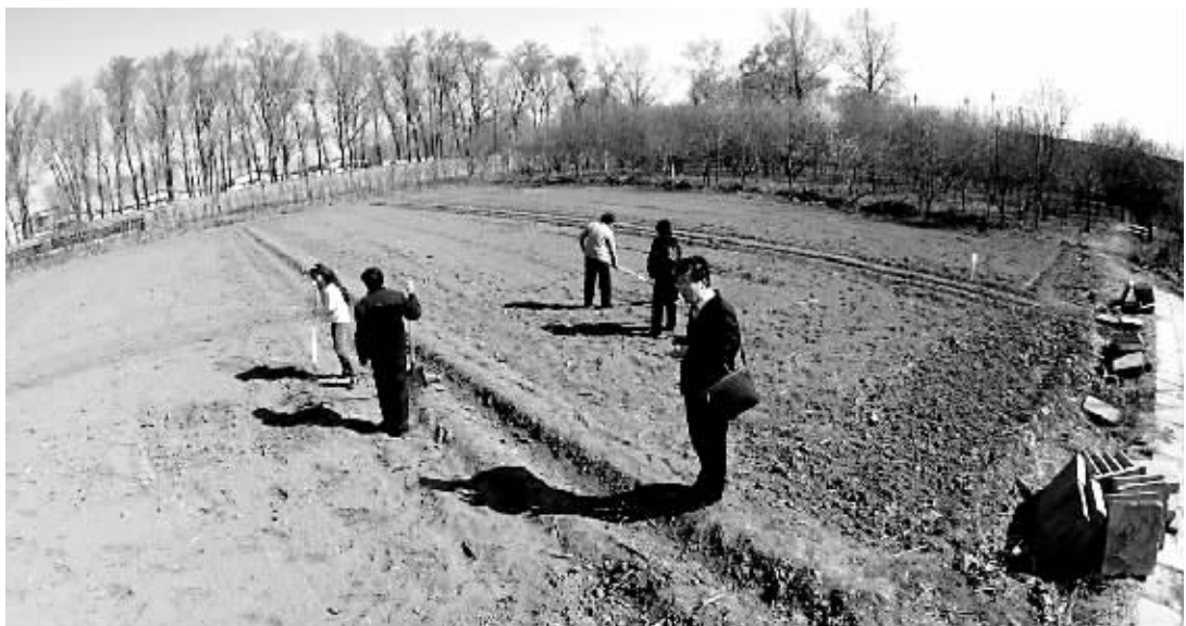
被划成小片出租的地。

去乡下租一小块地种些蔬菜和水果,体验劳动乐趣的同时又能体会收获的喜悦,目前,这种“农夫”般的休闲方式正在回龙观社区流行。