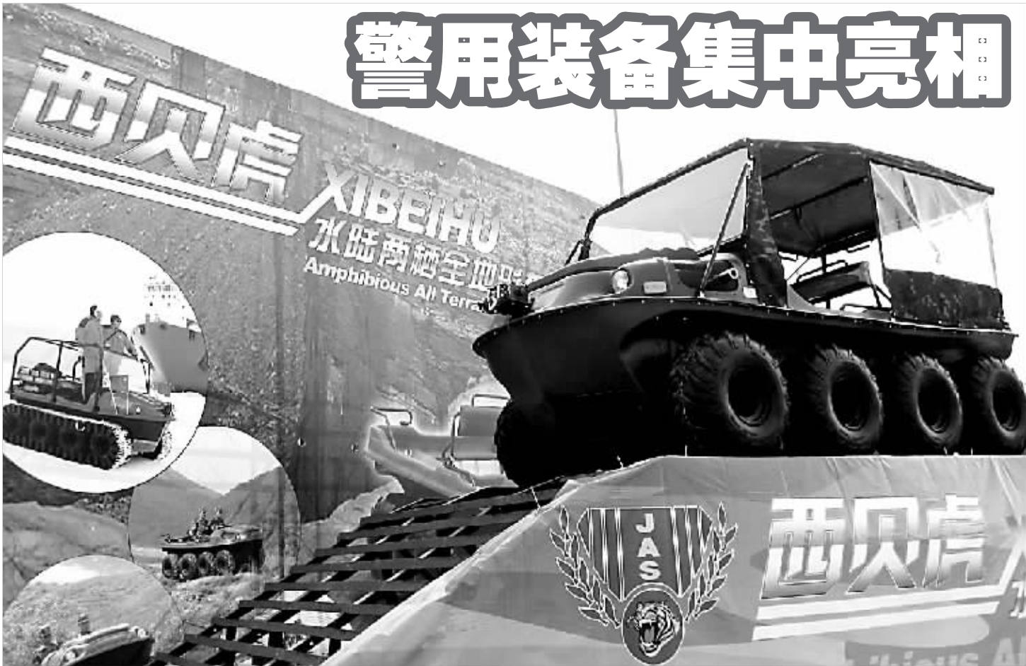
昨天,“第四届中国国际警用装备博览会”在北京展览馆举行。图为博览会上展出的水陆两栖全地形车。在我国第24次南极科学考察队开展的“海冰卸货”作业中,科考队员就是开着这种车进行海冰探路。