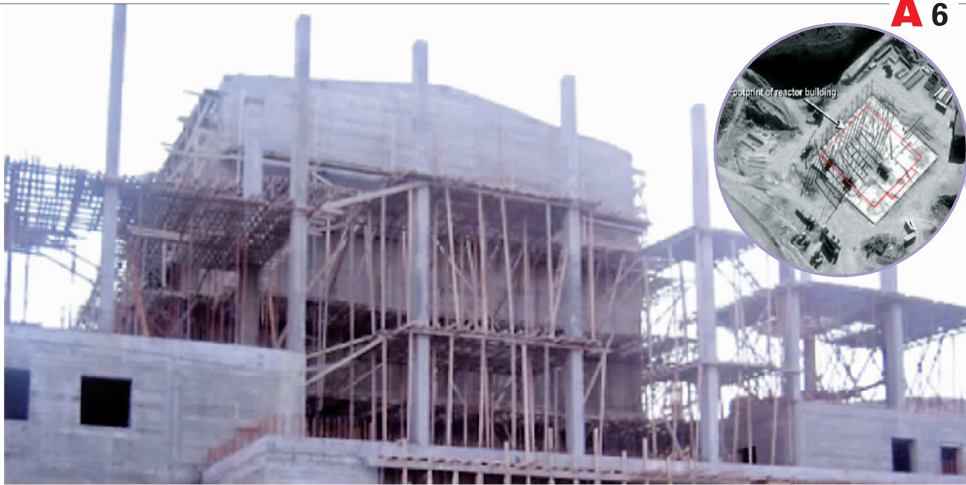
4月24日，美国高级官员在简报会上提供的未标日期的照片。大图为中国中情局认为的朝鲜帮助叙利亚建造的核设施，小图为卫星俯瞰图。

新华社电 英国一名男子于夜班时死于心脏病。最新死亡报告显示，他的死因可能与每晚喝过多功能性饮料红牛有关。