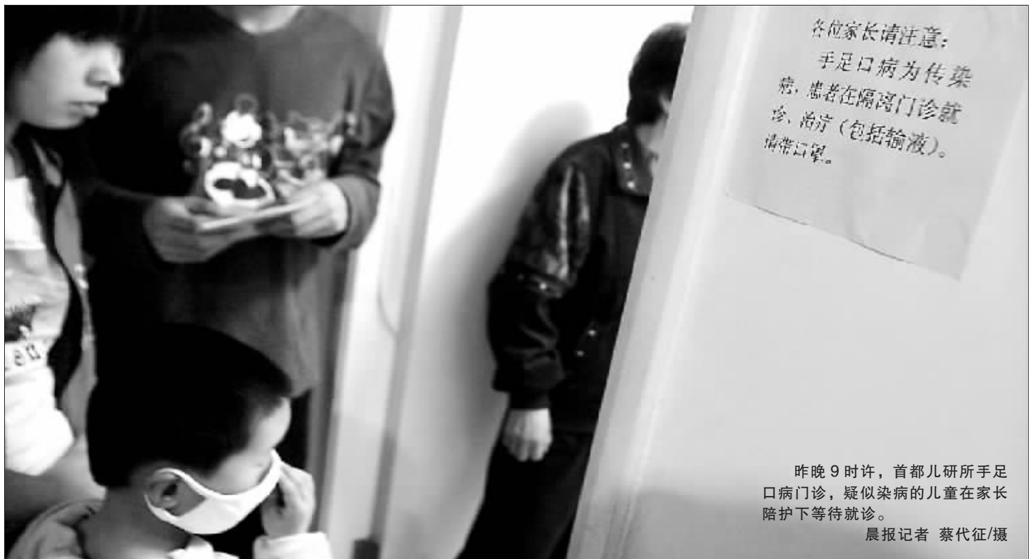
昨晚9时许,首都儿研所手足口门诊,疑似染病的儿童在家长陪护下等待就诊。