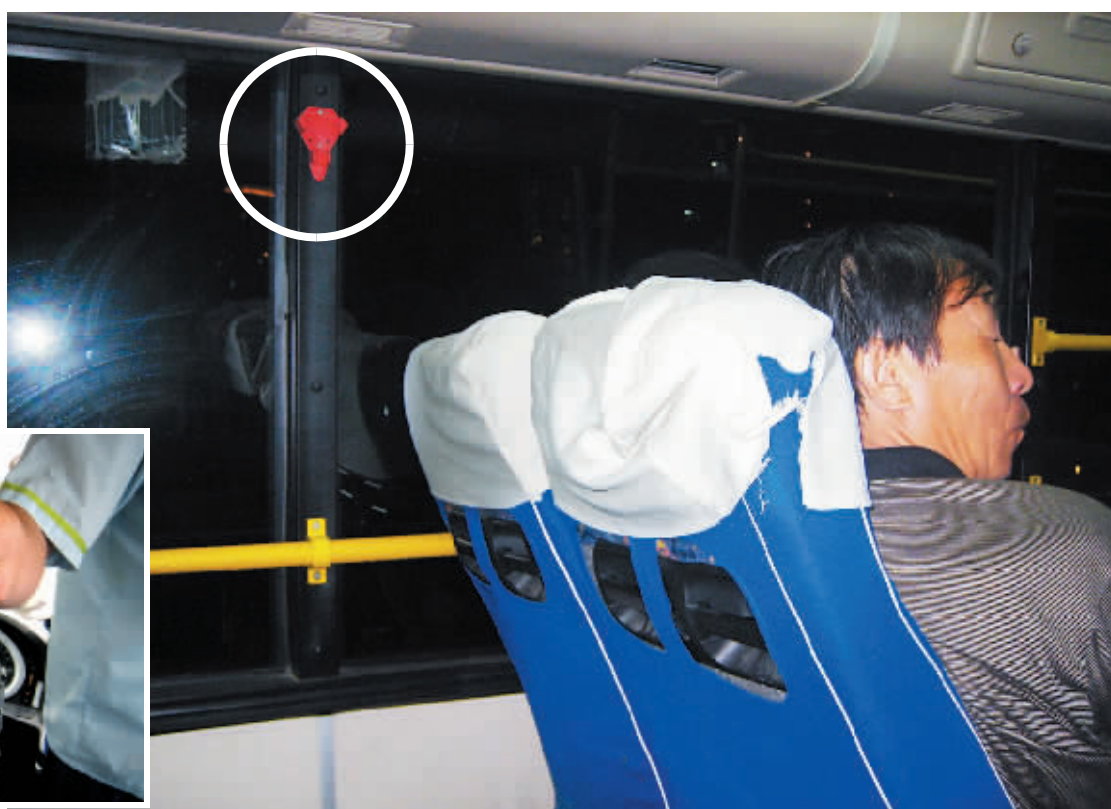
大图:放置铁锤的架子上空无一物。 小图:因为常被偷,小锤被司机收了起来。

昨天,有乘客致电本报反映,北京部分公交车上没有悬挂意外发生时破玻璃用的破砸锤。记者就此事调查走访了京城部分公交线路,发现确有封闭的空调车上没有破砸锤。市公交集团工作人员称,这种小锤是每一辆空调车出厂时必配的安全设施,一些公交车上无锤是因为频繁丢失所致。