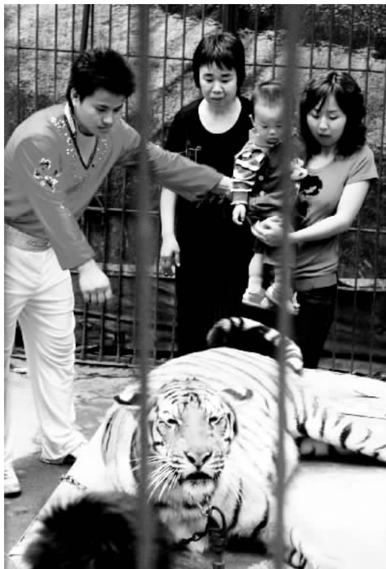
游客走进笼子和老虎合影。