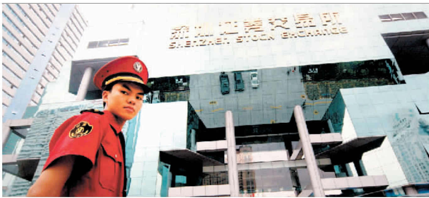
“大小非”在沪深两市连闯“红灯”，引来了交易所与监管层的高度警觉。