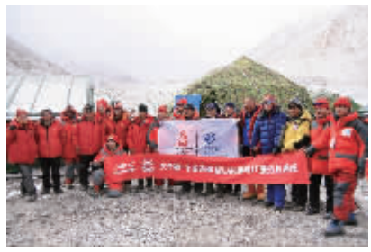
2008年4月,“中国移动-华硕VIP接待站”正式在海拔5200米的“珠穆朗玛大本营”落成,该站由中国国家登山队战略合作伙伴华硕电脑与第二十九届奥运

匹克运动会合作伙伴中国移动联合搭建而成,亦被称为“华硕珠峰大本营IT服务区”。服务区将为中国国家登山队及珠峰大本营工作人员在珠穆朗玛峰的全程活动中,提供信息技术支持及通讯服务。5月份,中国国家登山队将执行圣火登顶珠峰展示的光荣使命,作为国家登山队的战略合作伙伴,华硕电脑在去年就接到了为珠峰大本营IT服务区提供硬件设备及基础设施搭建的任务。