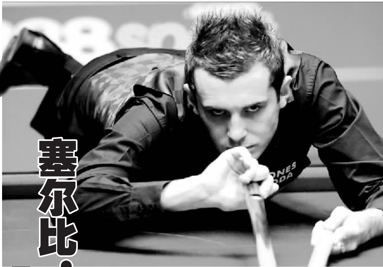
▲世锦赛首轮失利并没有让塞尔比丧失信心。