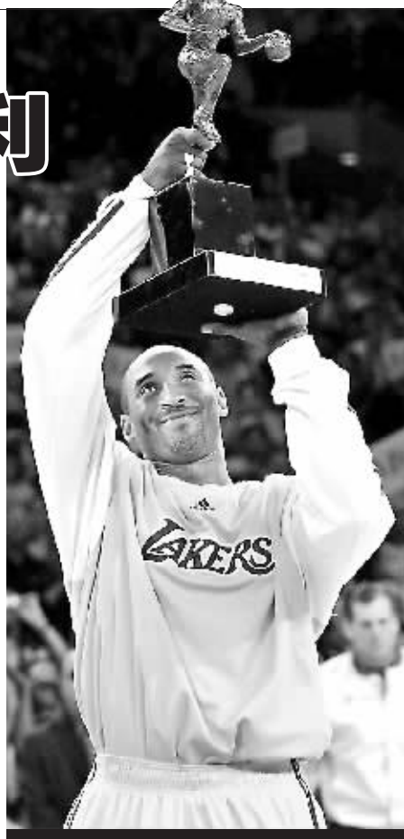
科比用胜利证明无愧于 MVP。

全场比赛科比18投11中,拿下34分,8个篮板,6次助攻。多次投中关键球的费舍尔贡献22分,3次抢断,保罗·加索尔得20分,5个盖帽。赛后美联社以“M-V-P!M-V-P!”为标题,对本场比赛进行了报道,文章指出科比在收获职业生涯首座常规赛 MVP 奖杯之后并没有放慢脚步,而是延续了 MVP 级的表现率领湖人队击败了爵士队,从而将总比分扩大为2比0。