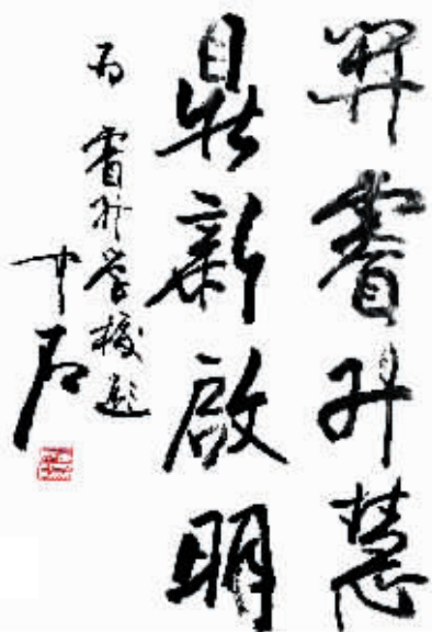
首都师范大学教授、中国书法文化研究所所长欧阳中石为睿升学校题词