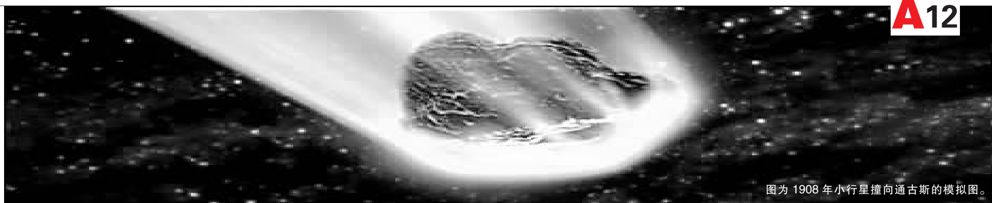
图为1908年小行星撞向通古斯的模拟图。