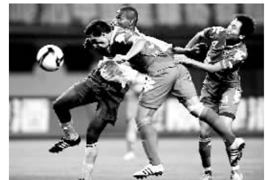
昨天，在中超联赛第12轮比赛中，长沙金德队主场以4比2战胜广州医药队。图为双方球员在比赛中拼抢。