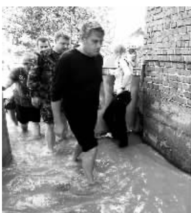
7月27日，尤先科(前)视察灾情。

新华社电 乌克兰官方27日说，乌克兰遭遇百年一遇的大洪灾，导致西部地区13人死亡。与此同时，邻国罗马尼亚也有4人在这次洪灾中丧生。