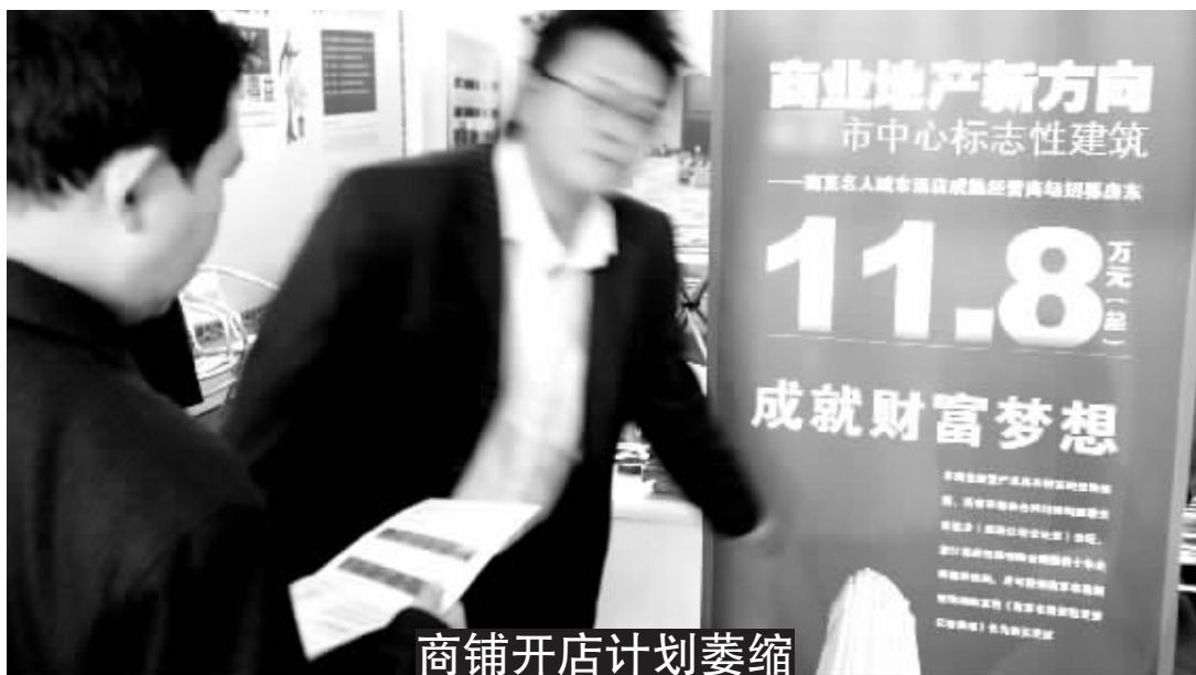
商铺开店计划萎缩