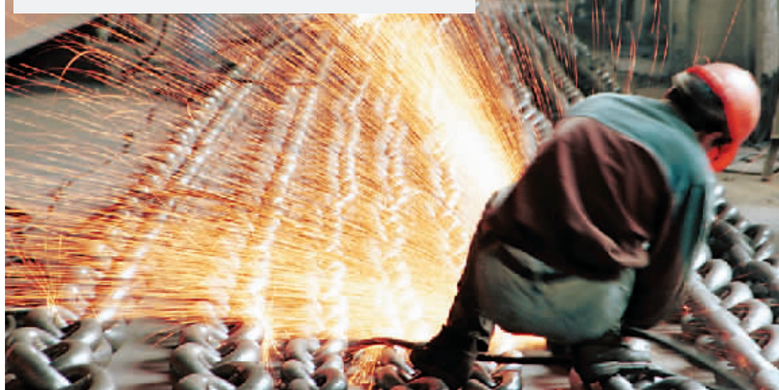
国际大宗商品价格剧烈回调是引领PPI大幅下滑的主要原因之一。