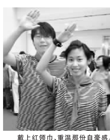
戴上红领巾、重温那份自豪感。

在棉花糖和果丹皮的香甜中戴上红领巾、两道杠，跳皮筋、玩泥巴，这不是小孩在过儿童节，而是城市白领们在重温自己的童年。“六一”来临，不光孩子们要过节，“超龄儿童”们也以各种方式过“六一”节。据活动组织者大众点评网社区工作人员介绍，两天参加“六一”现场活动的有近千人，都是年龄在25岁至35岁的白领。