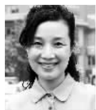
刘红宇 全国政协委员 市人大代表 金诚同达律师事务所高级合伙人

今天是“六一”儿童节，孩子们原本应该享受一个开心的假日，但因大部分家长不放假，又不放心把孩子一个人扔在家里，就出现了儿童节幼儿园阿姨放假、孩子跟着家长上班的尴尬一景。全国政协委员、市人大代表刘红宇呼吁，应该将“儿童节”给14岁以下的未成年人家长放假一天立法，以确保孩子们在“亲子的环境”里，享受自己的快乐节日。