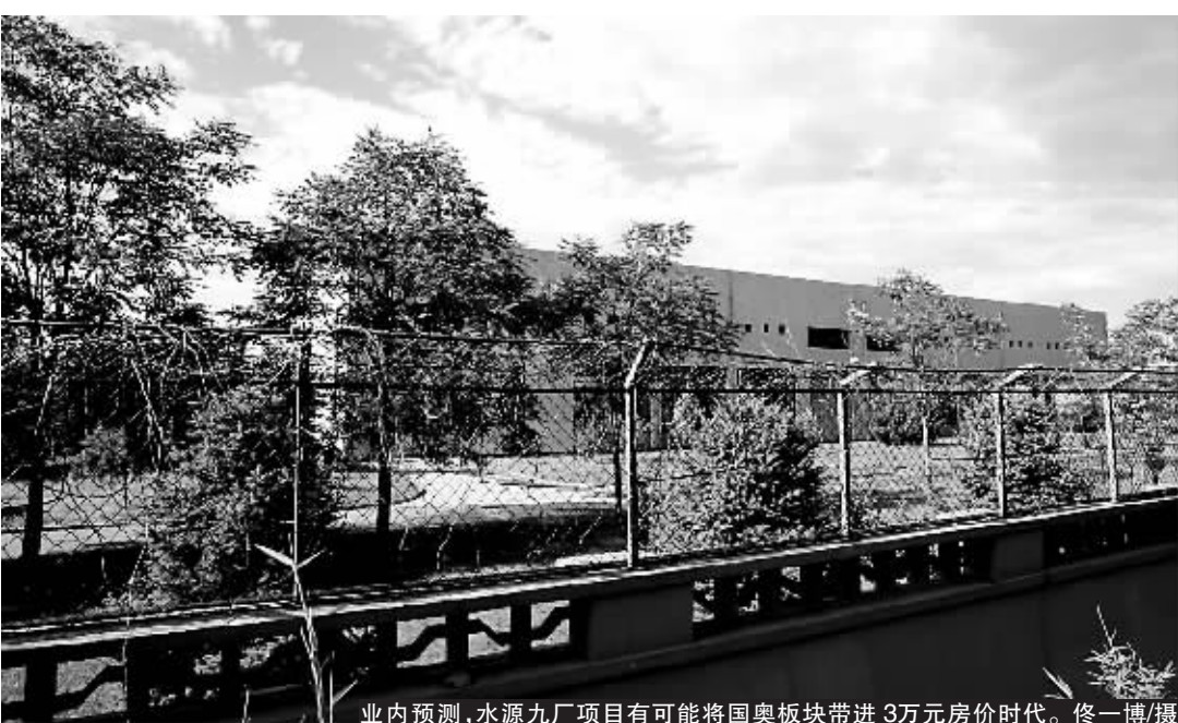
业内预测,水源九厂项目有可能将国奥板块带进 3 万元房价时代。