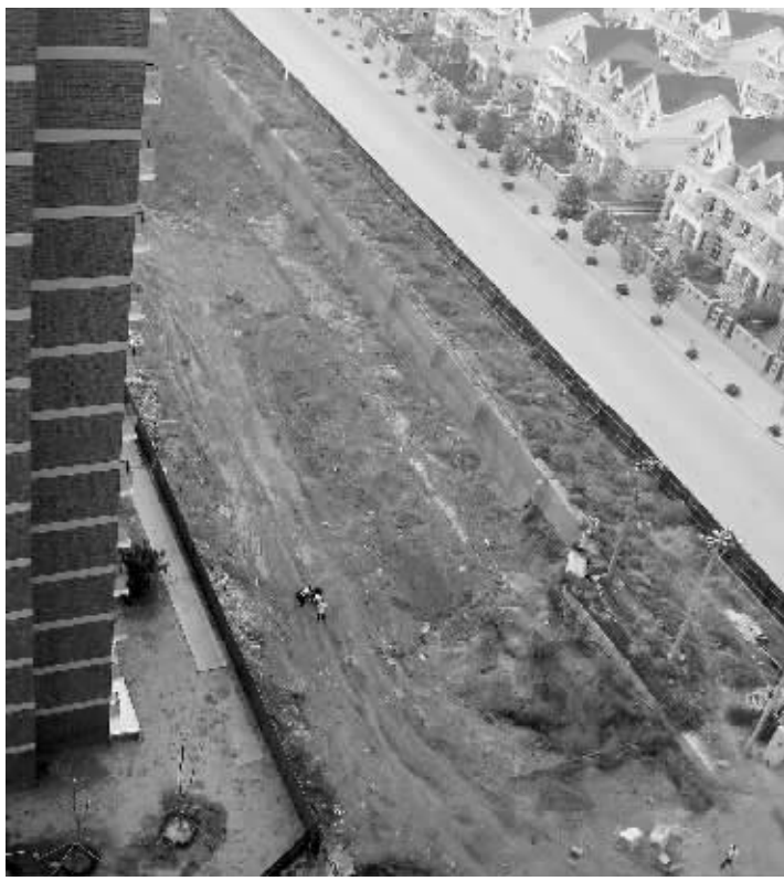
刚开挖的地库紧挨着住宅楼,让业主们忧心不已。

家住昌平区沙河高教新城北街家园一区的许多业主们近来为了离小区四幢住宅楼仅几米远的地库大坑发愁。原来,业主们入住几个月后,开发商开始在紧邻住宅楼的地方挖一个13米深的大坑修地库,业主们担心这会在地基仅有6米多的住宅楼造成压力差,影响房屋安全。对此,开发商北京罗顿沙河建设发展有限公司的工作人员表示,该工程已经专家论证,并无危险。