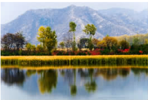
三等奖 湖光山色 作者:白纪总