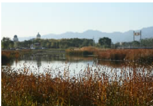
三等奖 金秋夏都 作者:田清保