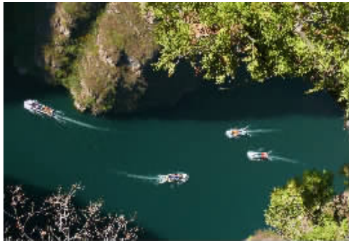
二等奖 峡谷穿梭 作者:程忠