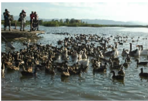
三等奖 野鸭湖畔 作者:赵广泉