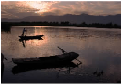
一等奖 晚归 作者:程忠