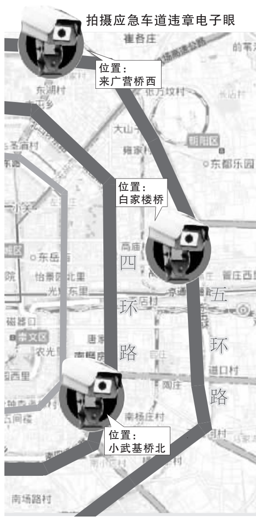
部分新增电子眼位置

交管部门介绍,特别在五环路上,一旦发生堵车,车辆占用应急车道的现象相当普遍,以致今年“7·28”东五环事故中,救援车辆难以及时到达现场。此次安装的识别号牌电子眼全部位于昌平、顺义、密云、怀柔、通州等远郊地区。和最初公布电子眼位置时相比,近期公布电子眼时,交管部门除了注明电子眼的种类,还将具体位置细化,详细标明设备拍摄的方向。如果是拍摄闯红灯等安装在十字路口的设备,还会注明两条相交道路的具体名称。根据交管部门先后 4 次公示统计,本市目前抓拍各类交通违法的电子眼共有 2187 个。