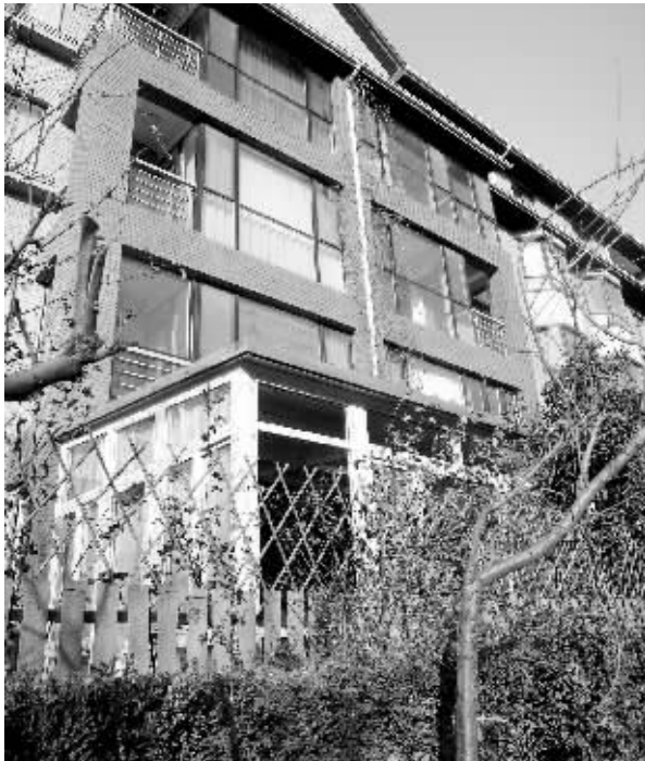
盖在小区内的违建阳光房。

小区物业客服部的负责人也证实了两人的身份,“物业劝说他们自拆不听,只能向城管举报。”该负责人说,这是小区中首例违法盖阳光房的行为,“我们一定要制止,否则以后居民效仿,小区就乱了。”