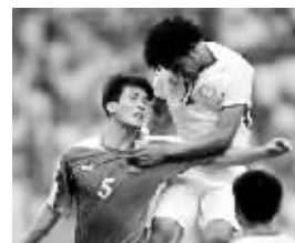
朝鲜队员(左)世预赛时身穿鸿星尔克球衣。

朝鲜队的情况有些特殊，在打进世界杯决赛圈比赛时，他们的球衣还是由中国品牌鸿星尔克赞助。但记者了解到，由于一些原因，鸿星尔克没能成为朝鲜队征战世界杯时的赞助商，届时，朝鲜队将可能由乐图赞助。