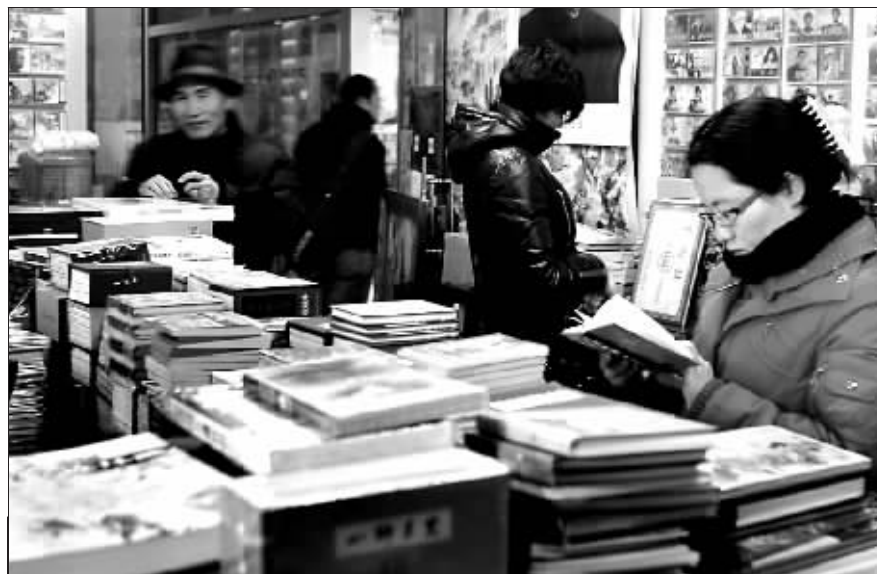
潘家园市场大厅二楼的小人书店,来搜寻各种小人书的“连友”络绎不绝。