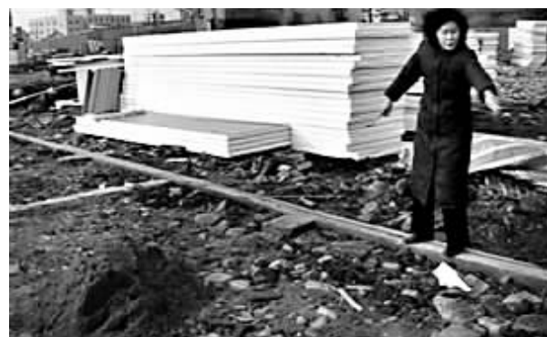
陈女士指的地方曾经是她的家,现在已经变成工地了。

记者随后联系了望春街道拆迁办公室。“怎么可能是我们拆的,我们也是陈女士报完警过来质询后,才知道发生了这种事。”对于陈女士的猜测,工作人员小朱马上否认。“她又没签拆迁合同,我们作为政府单位,怎么可能做这种违法的事情。这种老房子,又位于拆迁区,年底治安较差,可能是破烂王见