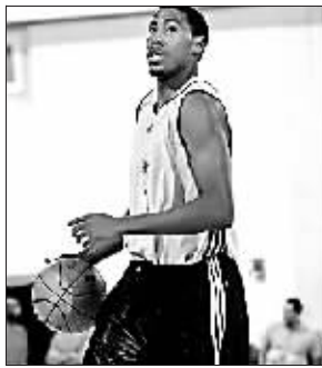
坦贝尔充当救火队员。

火箭队将于本周三做客迈阿密,挑战韦德领衔的热火队,这也是他们本周唯一的一场比赛,随后NBA将进入全明星周末,火箭将有一个星期的时间进行阵容磨合、体能储备。