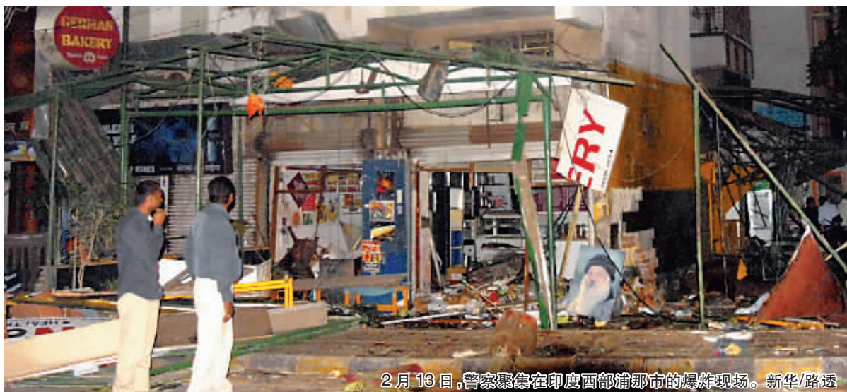
2月13日，警察聚集在印度西部浦那市的爆炸现场。