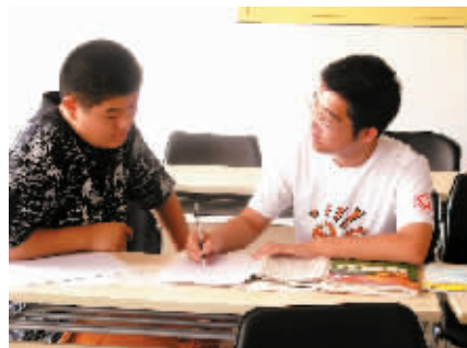
老师一对一对学生进行辅导

远非一般培训班所能同日而语。学生一般在培训学校上完课就走了,学懂的没学懂的,自己就带着问题回家了,培训学校不再进行跟踪管理。上学堂教育在这方面做了工夫。所有的学生下课后必须在助教那环节逐个检测当天所学内容才能离校。但凡有学生没有学懂当天所学内容都可留下来由助教再一对一免费为其补习,直到学懂弄懂为止。