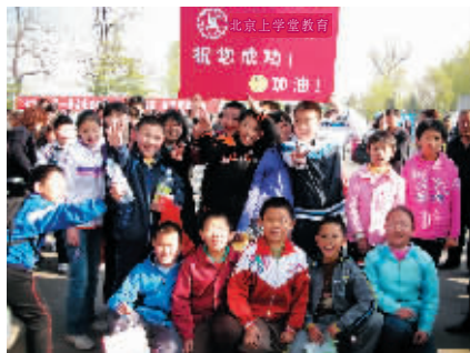
上学堂为学生快乐加油