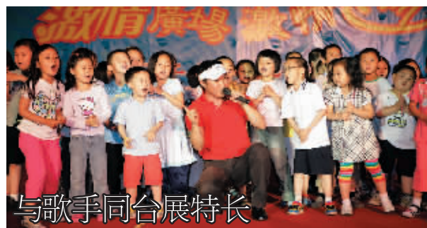
与歌手同台展特长

6月12日,北京市二十一世纪实验学校举办了“激情广场,激情飞扬”活动。该活动为学生展示特长,弘扬个性创设了平台,让学生体验崇高、感动心灵、放飞梦想、点燃激情,达到活动育人的目的。图为该校学生与歌手金波同台互动。森森