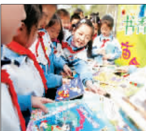
附小阅读节上孩子们在书香庙会中以书易书。

学校精神承载着学校的办学理念和价值取向,反映着学校的历史传统和精神风貌。朝师附小基于这种认识提炼出学校文化的核心价值观,培育积极向上的校风、教风和学风,构建和谐融洽的校园人际关系。已经初步形成教职工层面主流文化:我即代表学校;主动赢得认可;机会就是待遇;经历就是财富;高高兴兴干累活;帮助别人就是帮助自己;身体力行、以师育人;责任到此,请勿推辞;学生层面主流文化:学生明理立志、积极向上、乐